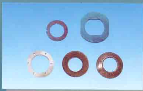
Minuteria su specifiche del cliente Customer-specified small items