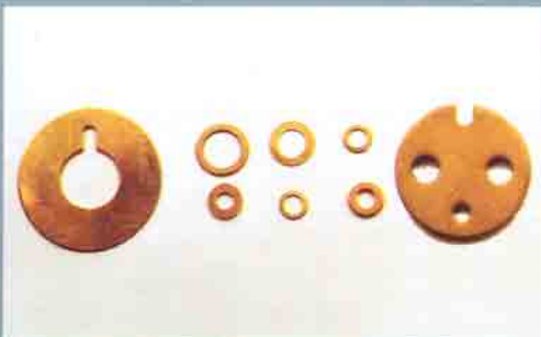
Rondelle ottone per pompe e valvole Brass washers for pumps and valves