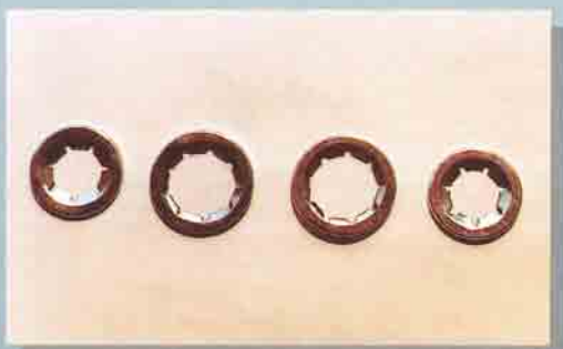
Star Lock in C.70 temprato zincato e deidrogenato Star locks made up with hardened, zinc-plated and dehydrogenated C70