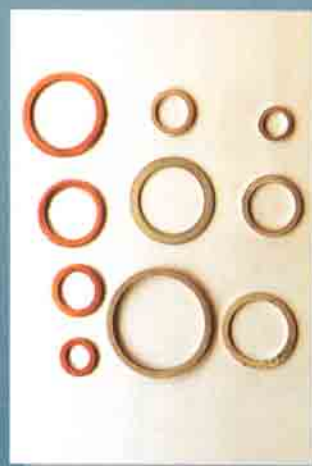
Guarnizioni in rame e alluminio Aluminium and copper gaskets

Washers si occupa dal 1991 di guarnizioni in rame e Alluminio.