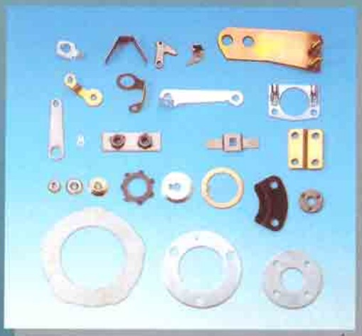
Minuteria su specifiche del cliente Customer-specified small items