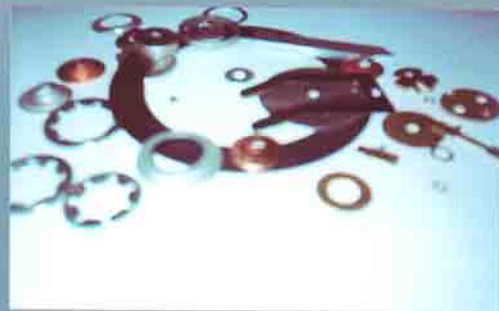
Minuteria su specifiche del cliente Customer-specified small items