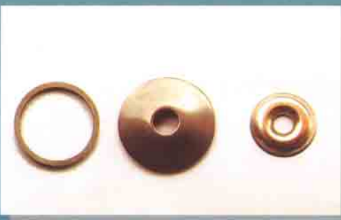
Particolari imbutiti e molla a tazza Drawn components and Belleville washers