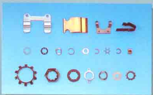
Minuteria su specifiche del cliente Customer-specified small items